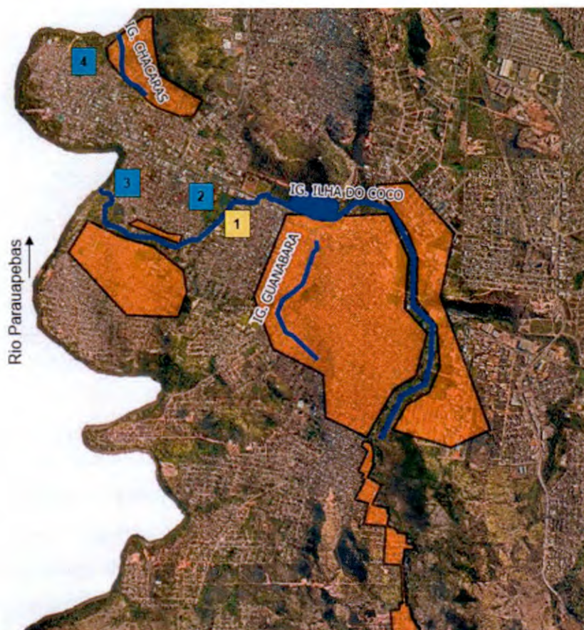
Figura 1: ETE's situadas na área de abrangência do PROSAP, sendo: 1) ETE Rio Verde; 2) ETE da Rua 19; 3) ETE da Rua 10; e 4) ETE Primavera.

As três estações que serão desativadas, as quais hoje possuem grandes lagoas de tratamento, após desativadas deixarão três vastas áreas remanescentes, que deverão receber um novo uso, de modo a favorecer a comunidade do entorno, bem como para evitar eventuais ocupações irregulares. Somadas, as áreas destas três ETE's totalizam aproximadamente 37.000 m 2 , distribuídos em bairros distintos do município.